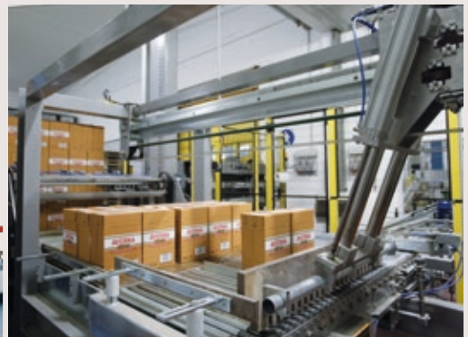
Palletizing and depalletizing systems.