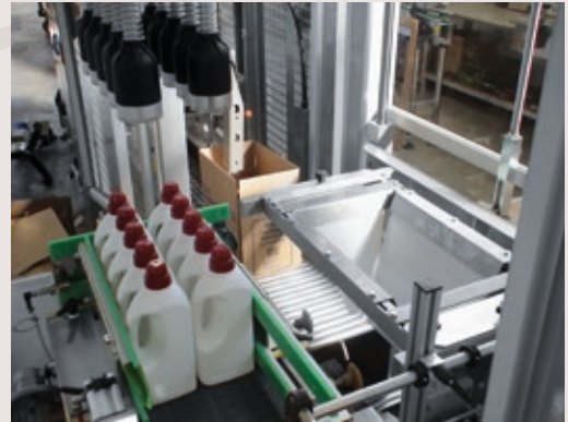
Pick and place packaging system.