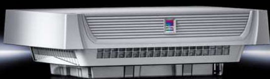
Таблица замен потолочных вентиляторов