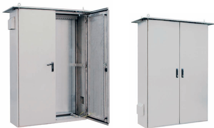
Электротехнические шкафы из нержавеющей стали, монтируемые на портовых кранах