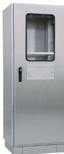
Электротехнический шкаф SZE2 из нержавеющей стали, специального исполнения