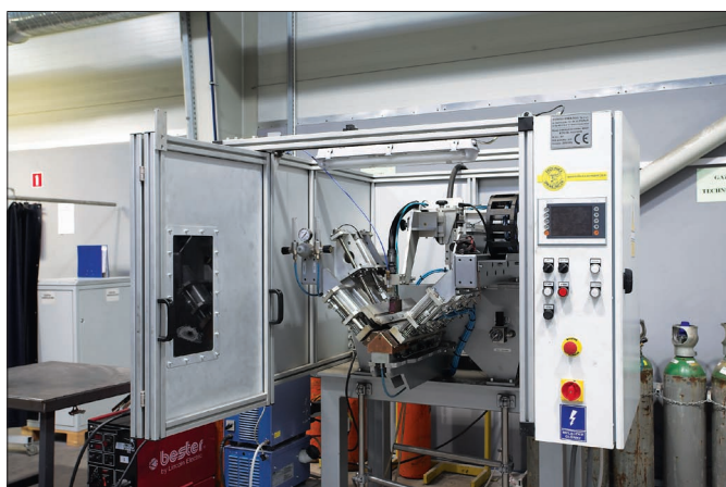
Автоматическая сварка корпусов шкафов SWN