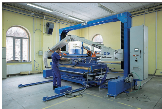
Машина для шлифования нержавеющей стали