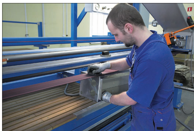
Обработка сварных швов корпуса шкафа из нержавеющей стали