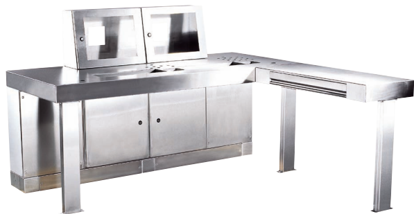
Диспетчерский пульт из нержавеющей стали, предназначенный для химической отрасли