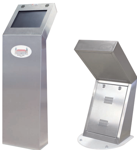
Информационные киоски из нержавеющей стали