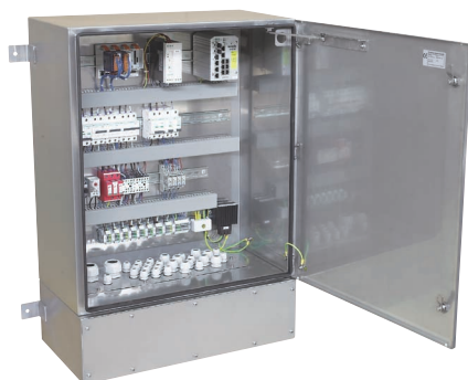
Шкафы из нержавеющей стали с электрооборудованием, исполненные согласно проекта, предоставленного заказчиком