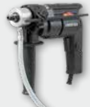
END 712 P 700 W; 0-8.000 min -1 ; Ø 3,5-12 (18) mm