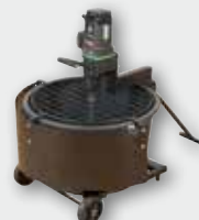
Automix 1801 1.500 W; 50 min -1 ; 65 l; Rührgutmenge 50 kg