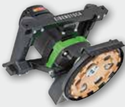
EBS 180 H 2.500 W; 8.500 min -1 ; Ø 180 mm