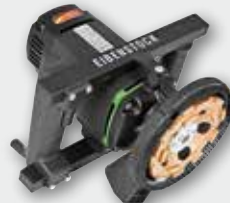
EBS 1802 1.800 W; 10.000 min -1 ; Ø 125 mm