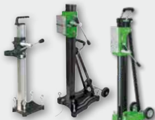
weitere Modelle auf Anfrage