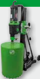
DBE 352 3.000 W; 230/500/1.030 min -1 ; Ø 42-352 mm