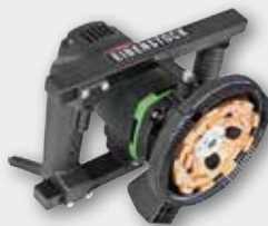
EBS 125.4 O/125.4 RO 1.500 W; 10.000/6.000-10.000 min -1 ; Ø 125 mm