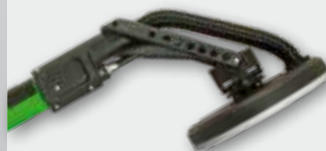
ELS 225.1 590 W; 1.050-1.600 min -1 ; Ø 225 mm