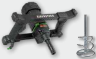
EHR 18.1 S Set 1.100 W; 0-450 min -1 ; Ø 120 mm; Rührgutmenge 40 kg