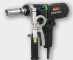
END 1550 P 1.500 W; 1.800-4.400 min -1 ; Ø 6-68 mm (opt. 50 mm)