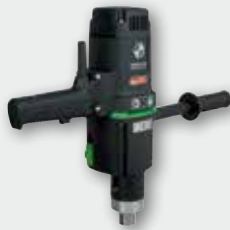
EHB 32/4.2 1.700 W; 110/175/245/385 min -1 ; Ø 32 mm in Stahl