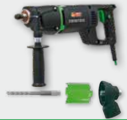
EHD 1500 Set 1.500 W; 0-2.000 min -1 ; Ø 32-82 mm