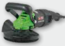
EBS 120.1 1.400 W; 9.000 min -1 ; Ø 125 mm