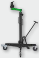
EBW 2300 1460-2300 mm; 550-1460 mm mit Maschinenarm (Zubehör)