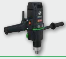
EHB 32/2.2 R R/L 1.800 W; 60-140/200-470 min -1 ; Ø 32 mm in Stahl