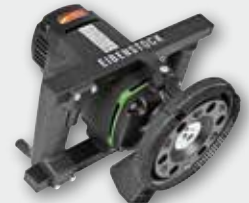
EBS 1802 SH 1.800 W; 10.000 min -1 ; Ø 125 mm