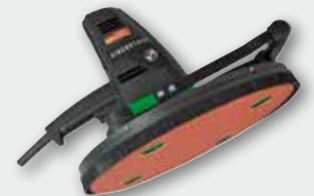
EWS 400 800 W; 0-85 min -1 ; Ø 370 mm