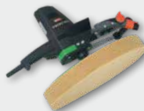
EPG 400 WP 500 W; 0-60 min -1 ; Ø 370 mm