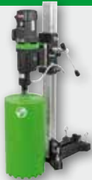
DBE 250 R 2.500 W; 360/850 min -1 ; Ø 52-250 mm