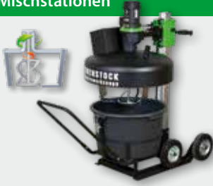
TwinMix 1800 T 1.800 W; 250/450 u. 20/36 min -1 ; 65 l; Rührgutmenge 50 kg