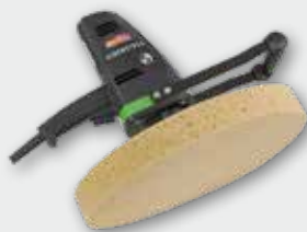
EPG 400 500 W; 0-60 min -1 ; Ø 370 mm