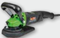
EOF 100 1.400 W; 10.000 min -1 ; Ø 100 mm