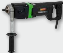
EHD 2000 S 1.700 W; 0-1.000/0-2.000 min -1 ; Ø 32-132 mm