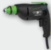
ESR 450 450 W; 0-4.000 min -1 ; Ø 5 mm; 1,2 kg