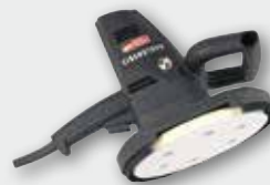
ETS 225 700 W; 0-1.450 min -1 ; Ø 225 mm