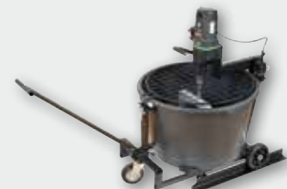
Automix 90 1.500 W; 50 min -1 ; 90 l; Rührgutmenge 80 kg