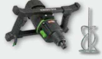
EHR 23/2.5 S Set 1.800 W; 0-250/0-580 min -1 ; Ø 180 mm; Rührgutmenge 80 kg