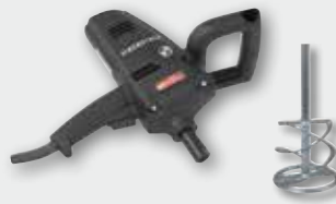
EHR 14.1 SK Set 960 W; 0-390 min -1 ; Ø 120 mm; Rührgutmenge 30 kg