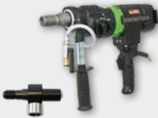
PowerLine PLD 182 NT 2.300 W; 0-520/-1.250/-2.700 min -1 ; Ø 12-182 mm