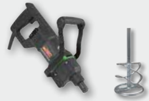
EHR 15.1 SB Set 1.050 W; 0-450 min -1 ; Ø 120 mm; Rührgutmenge 40 kg