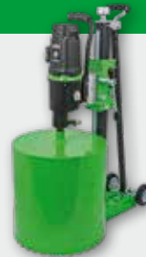
PowerLine PLE 450 B 3.300 W; 180/400/780 min -1 ; Ø 71-450 mm