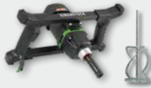
EHR 20.1 R Set 1.300 W; 250-580 min -1 ; Ø 140 mm; Rührgutmenge 50 kg