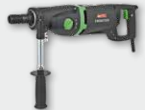
ETN 162/3 2.200 W; 0-510/-1.150/-2.500 min -1 ; Ø 12-162 (202) mm