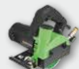
EDS 125 1.250 W; 12.000 min -1 ; Ø 125 mm; max. Schnitttiefe 36 mm