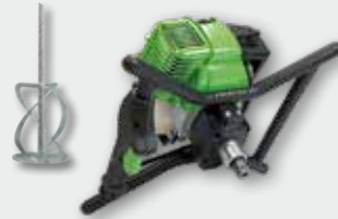
EHR 750 B 0,75 kW/1,0 PS; 0-450 min -1 ; Rührgutmenge 80 kg