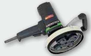
EPF 1503 1.500 W; 4.000 min -1 ; Ø 140 mm