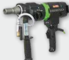
PowerLine PLD 182 2.300 W; 0-520/-1.250/-2.700 min -1 ; Ø 12-182 mm