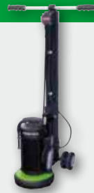
EBS 235.1 2.200 W; 1.380 min -1 ; Ø 235 mm