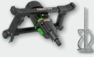
EHR 20/2.6 S Set 1.300 W; 0-250/0-450 min -1 ; Ø 140 mm; Rührgutmenge 50 kg