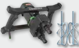
EZR 22 R R/L Set 1.300 W; 140-400 min -1 ; Ø 220 mm; Rührgutmenge 60 kg