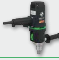
EHB 20/2.4 1.150 W; 250/450 min -1 ; Ø 20 mm in Stahl