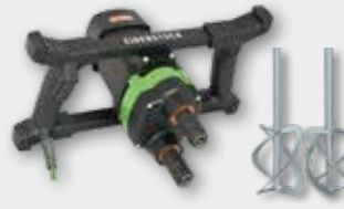
EZR 23 R R/L Set 1.800 W; 200-530 min -1 ; Ø 230 mm; Rührgutmenge 80 kg