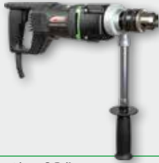
EHB 16/1.4 S R/L 1.150 W; 0-450 min -1 ; Ø 20 mm in Stahl