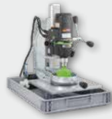
EFB 152 PX (mit Pumpe) 1.150 W; 250-1.000 min -1 ; Ø 6-120 mm