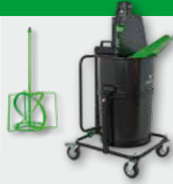
FloorMix 2300 2.300 W; 70/130/160/280 min -1 ; 110 l; Rührgutmenge 150 kg