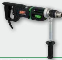
EHB 16/2.4 S R/L 1.150 W; 0-430/0-760 min -1 ; Ø 20 mm in Stahl