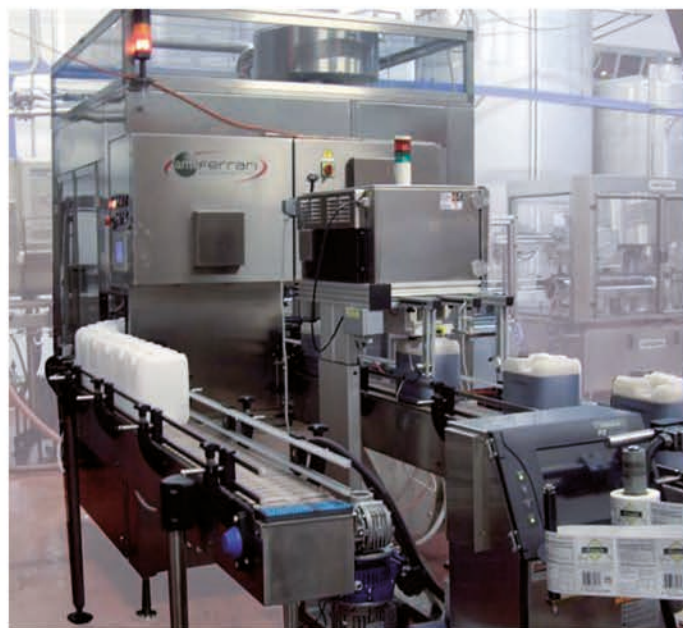
Volumetric Monoblock for jerry can - capping detail