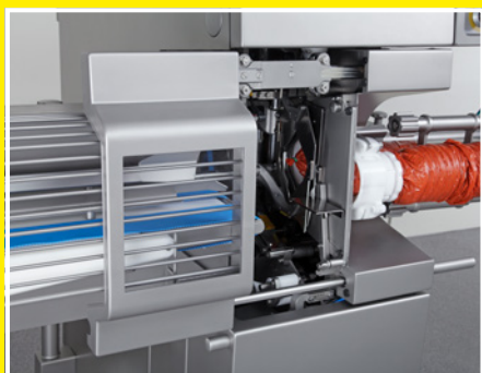
Минимальное время на переналадку за счет откидной передней дверцы