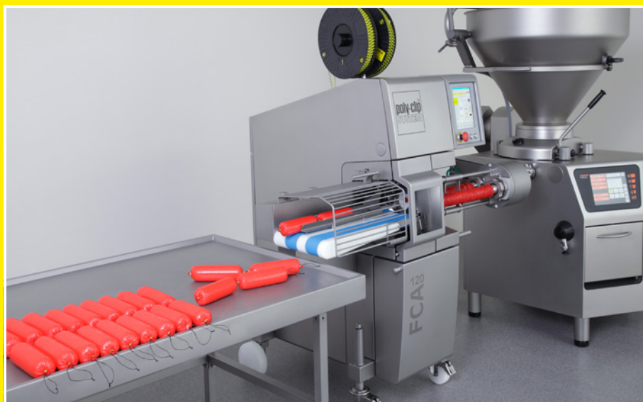
FCA 120 – специалист по высокоскоростной работе в диапазоне калибров до 120 мм