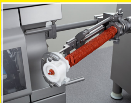
Ассистент тормоза оболочки – полуавтоматический держатель тормоза оболочки