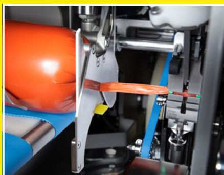
Подпрессовка для безвоздушного наполнения формованных продуктов