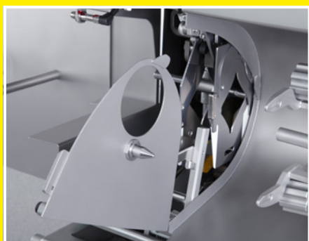
Чистящая заслонка фаршевытеснителя