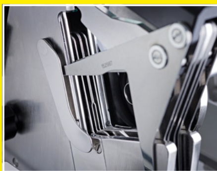
Регулировка фаршевытеснителя под продукт – большее количество циклов