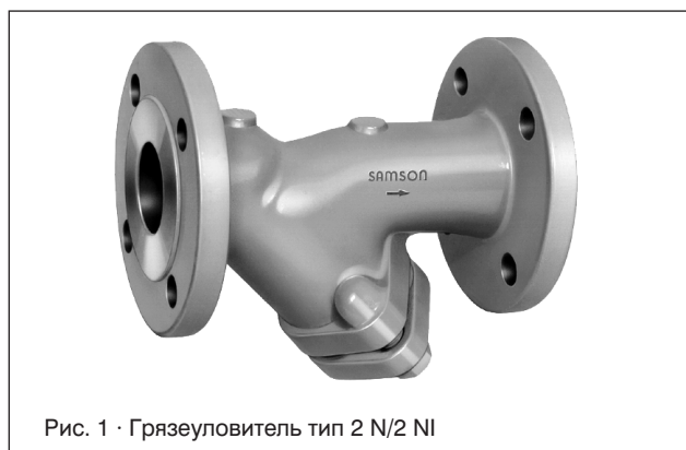
Рис. 1 · Грязеуловитель тип 2 N/2 NI

– фланцы со шпонкой / выступом / углублением – по запросу –