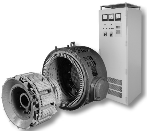
Структура условного обозначения двигателей типа БСДКМ